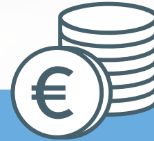
Pijler 2 Markt