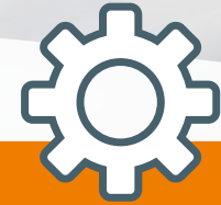
Pijler 3 Organisatie