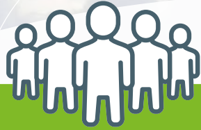
Pijler 1 Inwoners