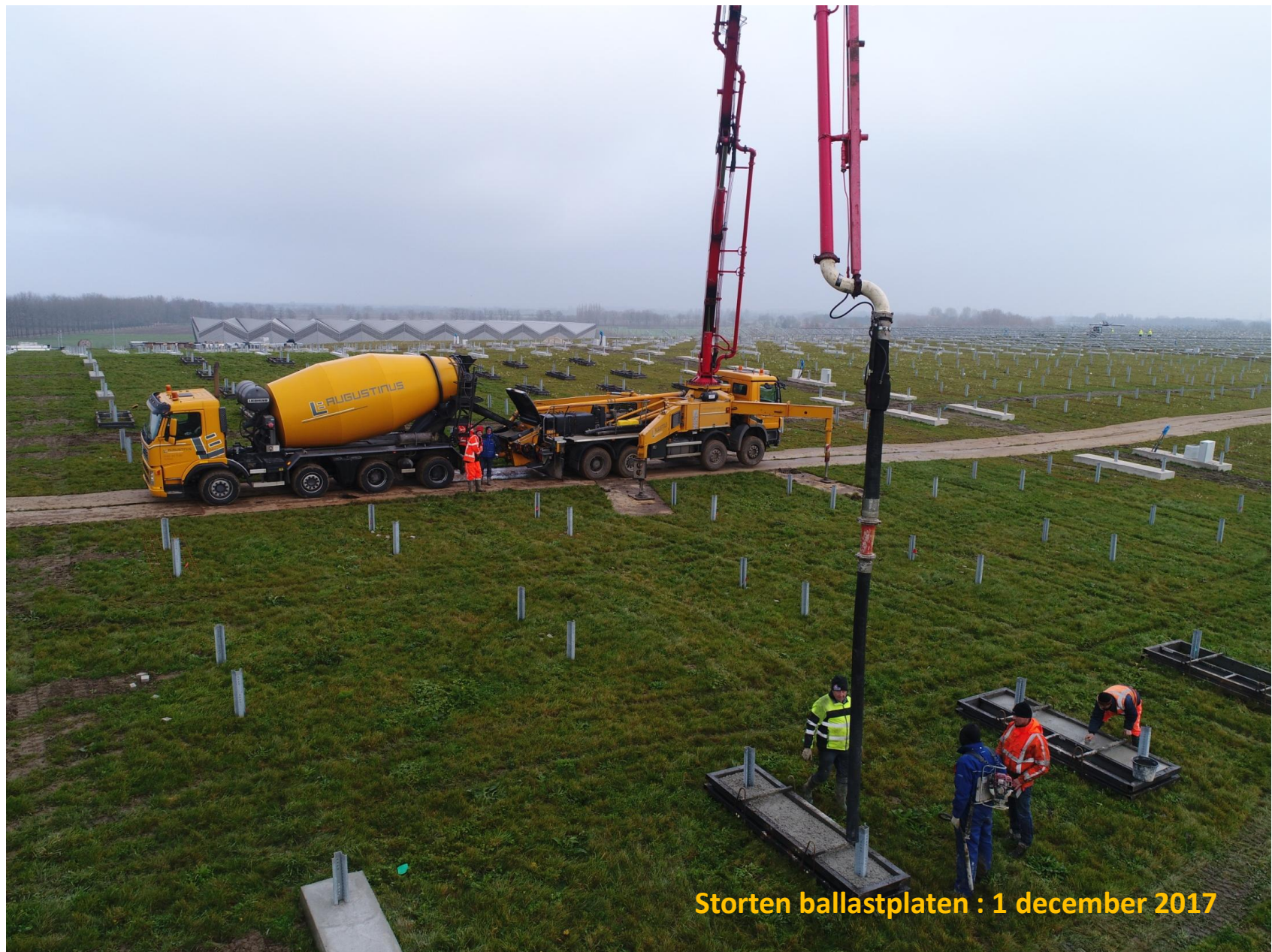
Storten ballastplaten : 1 december 2017