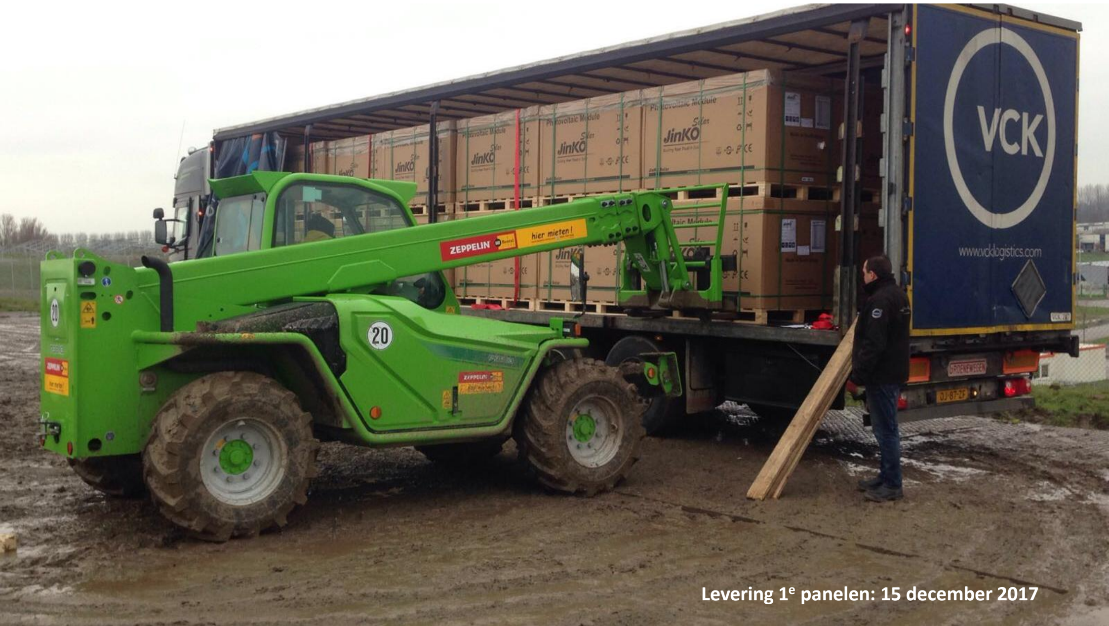
Levering 1 e panelen: 15 december 2017