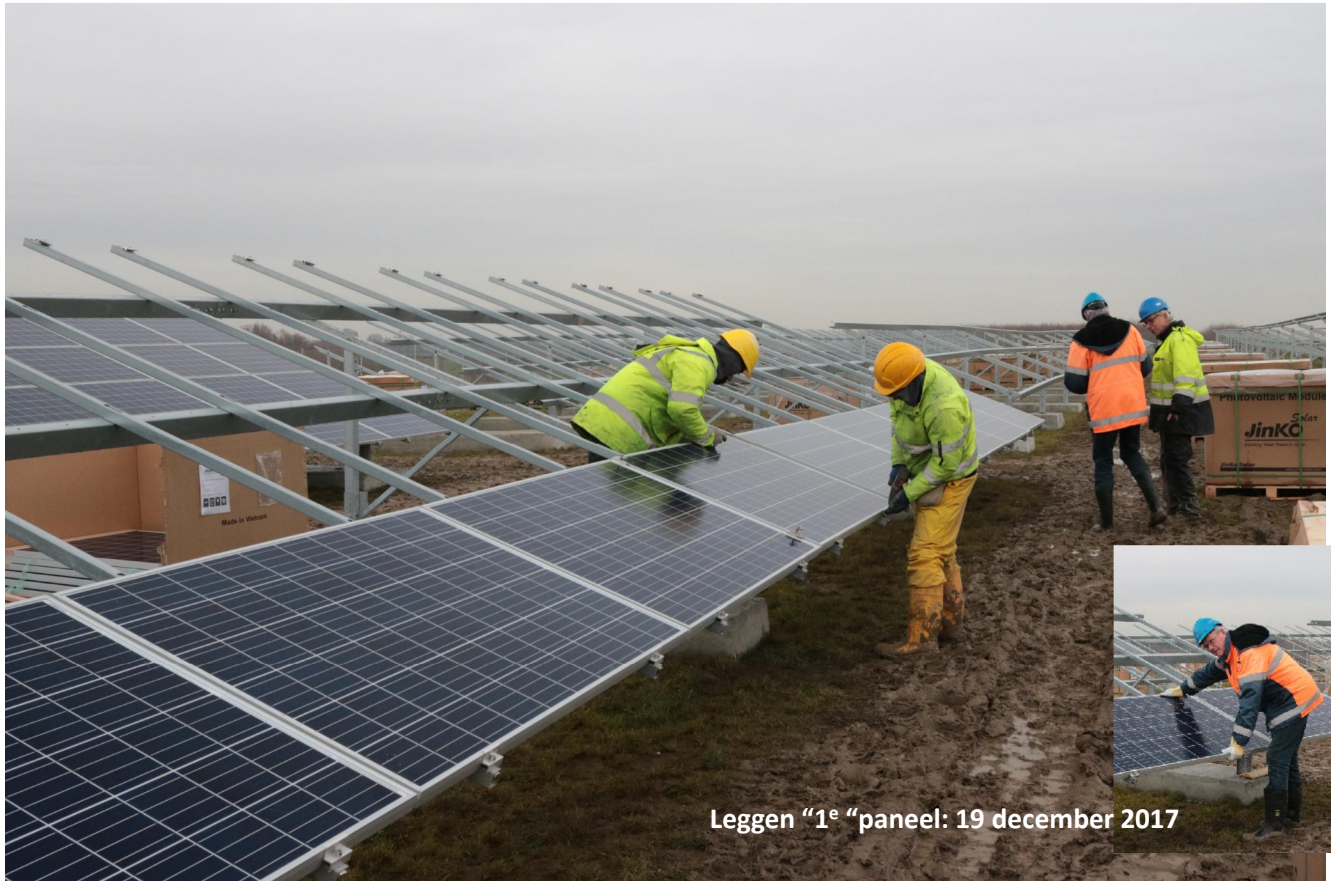
Leggen "1 e " paneel: 19 december 2017